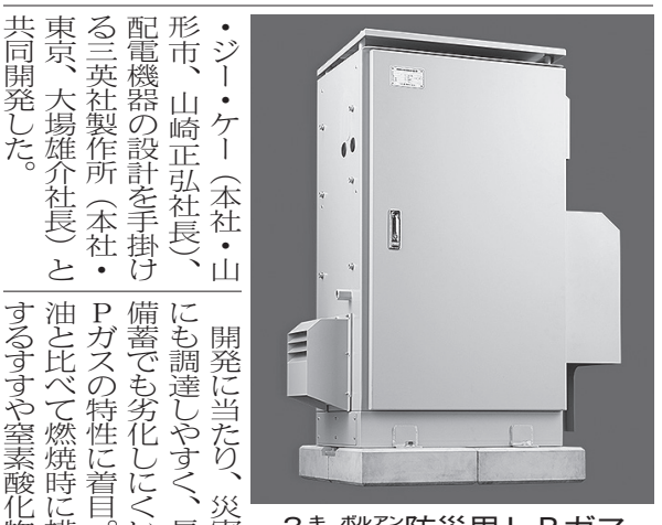
3kVA防炎用LPガス発電機「YL03-3GC」

関電工(本社・東京)は、3kVA防炎用LPガス発電機「YL03-3GC」を発売し、エンジン制御装置を一つの筐体に納めた定置式で、停電時には自動切り替えて40秒以内で起動し、インバータを介して高品質な電力を供給する。エンジン・発電機を一つの筐体に納めた定置式で、停電時には自動切り替えて40秒以内で起動し、インバータを介して高品質な電力を供給する。エンジン・発電機を一つの筐体に納めた定置式で、停電時には自動切り替えて40秒以内で起動し、インバータを介して高品質な電力を供給する。