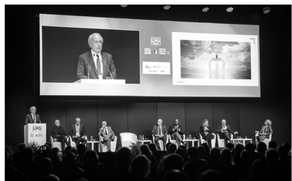
前回ローマ大会の会議セッション

世界リキッドガス協会(WLGA、本部・パリ、タバハラ・ベルテッリ・コスタ理事長)が主催するLPガス産業最大の国際イベント「LPGウイーク」のメイン会議。昨年はイタリアのローマで現地とオンライン併催で行われ、世界から約2,000人のLPガス業界企業・団体・政府関係者などが参加した。LPGウイークはフォーラムのほか、技術展示会や世界技術会議、注目テーマの専